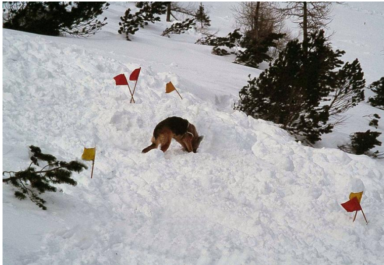
Zasuti je brez ustrezne opreme, brez lavinske žolne, obsojen na čakanje organizirane pomoči