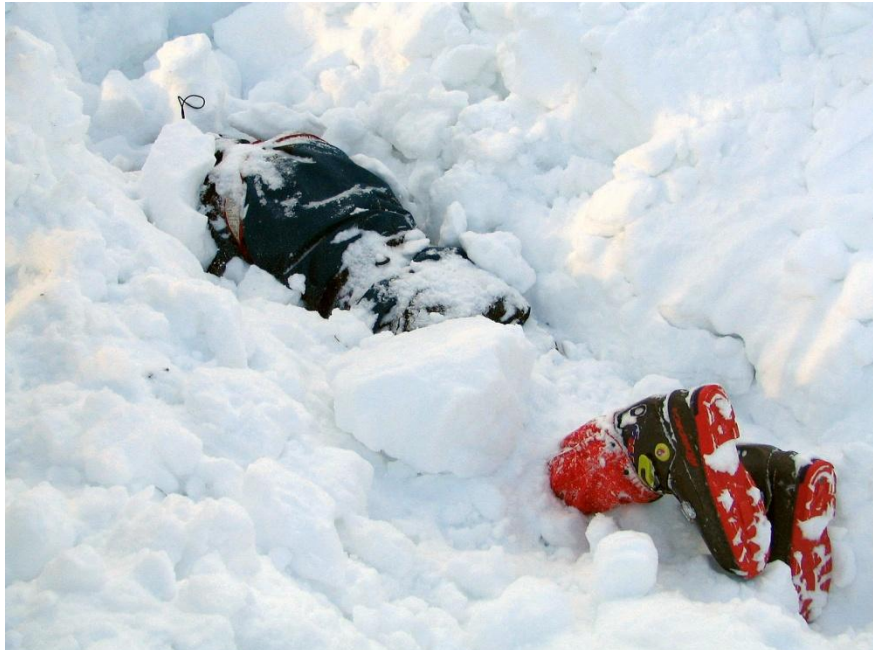
Hitri pregled plazovine je pomemben. Žrtvi, ki je vidna lahko hitro in kvalitetno pomagamo.

Naj navedem primer. Zgodilo se je... Na plazovini opazimo delno zasutega in v naglici odločimo, da je z njim vse v redu, saj ni zasut. Lotimo se iskanja drugega. Žolna nas vodi do mesta izvora signala, sledi sondiranje, odkopavanje... Na žalost na koncu ugotovimo, da je zasuti doživel takšne poškodbe, ki niso združljive z življenjem. Odpravimo se k prvemu. Bil je v nezavesti, dihal je, vendar je imel obraz zarit v sneg. Medtem, ko smo se ukvarjali z iskanjem popolno zasutega se je zadušil.