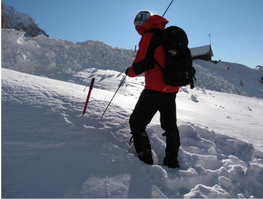
Na mestu najboljšega signala zasadite lopato in takoj pričnite s pravokotnim spiralnim sondiranjem

O situaciji, ko je zasutih hkrati več oseb: http://www.volontar.net/clanek_prikazi.php?pid=23