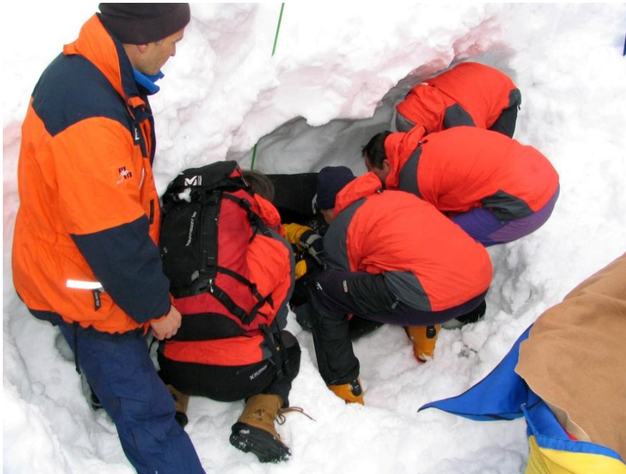
Odkopani prostor mora nuditi dovolj prostora za pravilno obravnavo zasutega

Poizkušamo narediti nekakšen stožčast kanal, ki bo širši na zunanji strani in ožji na strani, kjer je zasuti. Kopači se razvrstijo v obliko klina, eden na čelu in potem izmenično za njim po dva in dva kopača. Kopači naj bodo med seboj oddaljeni za dve dolžini lopate, da se med odmetavanjem ne zadevajo po nepotrebem. Kopljejo v pol-klečečem ali klečečem položaju. Sneg odmetavajo z gibi telesa ne samo z rokami. V bistvu zares koplje le prvi v piramidi. Sneg potiska ali meče samo za sebe. Naslednja dva kopača nekaj malega kopljeta ob strani, glavna naloga pa je, odstranjevanje snega, ki ga je nakopal čelni kopač. Naslednji par kopačev se ukvarja izključno s čiščenjem snega, ki ga proti širšemu delu kanala narivajo prvi trije. Praktično kopači ne mečejo snega v stran, ampak ga porivajo po sredini kanala nazaj. Na lopato zajemamo le toliko snega, ki ga brez težav odložimo, kjer želimo. Če je snega na lopati preveč, če sekamo prevelike kepe, se zgodi, da nam sneg zdrsuje z lopate in pada nazaj v izkopan kanal. Dvojno delo pa ne pripomore k učinkovitosti. Kopači svoje položaje med seboj zamenjajo vsakih nekaj minut, da pri napornem delu nenehno ne obremenjujejo istih mišic.