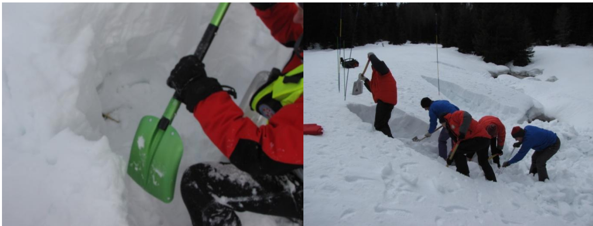
Kopač na čelu naj seka sneg in ga poriva nazaj. Kopači za njim odkopan sneg delno odkopavajo stranice in po sredini kanala sinejo sneg nazaj

Čaka nas najnapornejši in najdaljši od segmentov reševanja zasutega. Za zasutega je zračni žep, prostor pred obrazom, življenjskega pomena. Ne porušimo mu ga. Kako se lotimo odkopavanja je odvisno od globine zasutega, to ugotovimo s sondo in od časovne oddaljenosti od dogodka... V vsakem primeru se nekoliko odmaknimo od sonde navzdol in pričnimo s kopanjem. Začetek kopanja, odmik od sonde je odvisen od globine zasutega. Kopati začnemo približno 1,5 do 2 kratno globino zasutega, na spodnji strani sonde. Bolj je teren položen, dlje proč od sonde moramo začeti kopati. Tako bomo k zasutemu dostopali z boka. Med kopanjem ne bomo teptali snega nad njim, ne bomo poškodovali morebitnega zračnega žepa. Kako se lotimo odkopavanja je odvisno od števila ljudi, ki so na voljo.